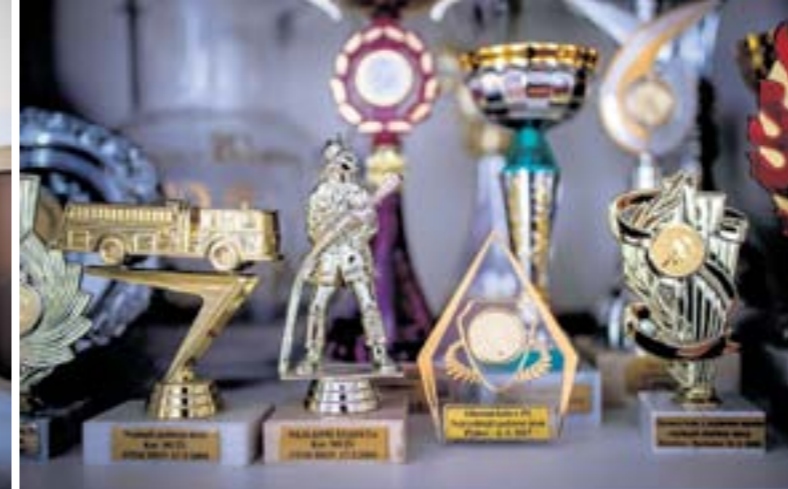
TROFEJE. Hasiči z Velvar jich za uplynulá desetiletí získali při soutěžích nepřeborně.