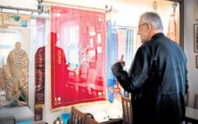
KLUBOVNA. Na historické prapory jsou velvarští dobrovolní hasiči právem hrdí.