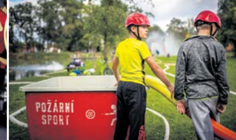
TRÉNINK. Oddíl mladých hasičů se schází každý pátek. A dětem bývá veselo.

M ožná znáte hořkou komedii Hoří, má panenko, kterou natočil Miloš Forman v roce 1967 o jednom venkovském hasičském bálu. Asi byste si vzpomněli i na jiné filmy nebo seriály, v nichž se objevují dobrovolní hasiči. Často jsou vykreslováni s humornou nadsázkou spíše jako svérázní strejci než bůhvíjací chlapáci, či dokonce hrdinové. Ale jaká je skutečnost? Kdekdo z obyvatel malých měst nebo vesnic vám potvrdí, že místní hasiči bývají hlavní hybnou silou, která má na dění v obcích pozitivní vliv.