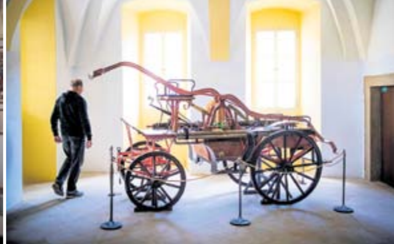
UNIKÁT. V roce 1904 převzali hasiči novou koněspřežnou stříkačku za 2 200 korun. K vidění je na radnici.